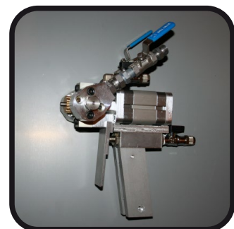
Pistolet Graveco Raptor IV

Zapraszamy serdecznie, doradztwo bezpłatne poparte wieloletnim doświadczeniem w branży urządzeń kontrolowanych numerycznie.