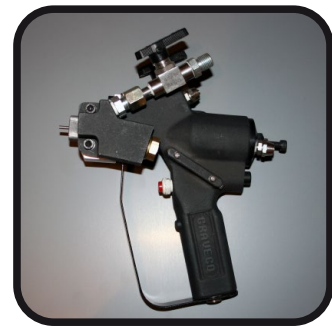
Pistolet Graveco Standard