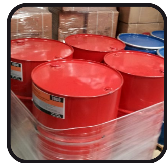
Komponenty do natrysku